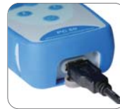
USB 데이터 출력