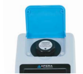
[ Cell 8각 뚜껑 & 플립형 커버 ]